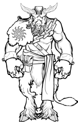
Minos, personnage mythologique