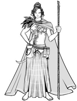
Feuille d'Automne, personnage fantastique

Variable, mais par défaut nombre de faces du talent de pouvoir x2.