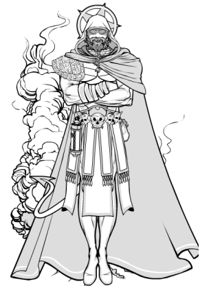
BaalKhan, personnage démoniaque