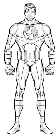
Captain Earth, personnage super-héroïque