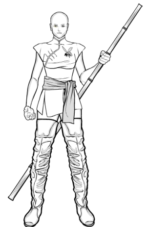
Tao Ping, personnage de wu xia pian

Mais en attendant c'est à vous de jouer !