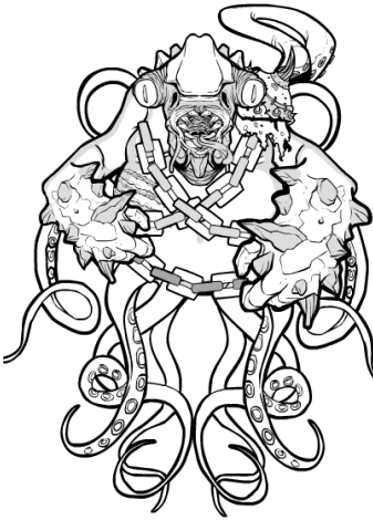
Le Kraken, créature monstrueuse